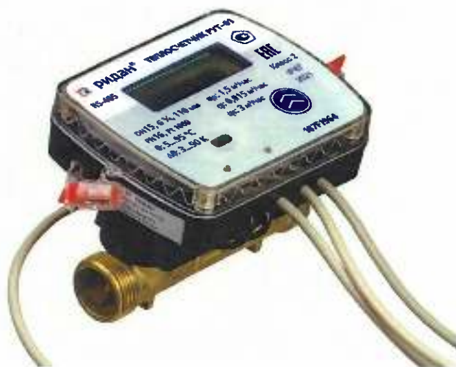
Рисунок 1 – Общий вид теплосчетчиков РУТ-01

Схема пломбировки от несанкционированного доступа представлена на рисунке 2.